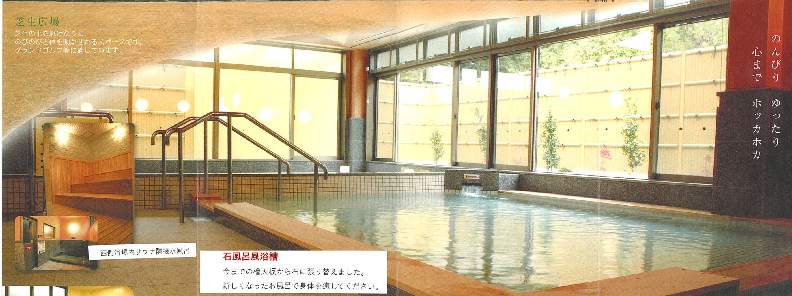
西側浴場内サウナ隣接水風呂